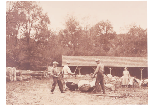
La scierie de Romilly aux environs de 1950